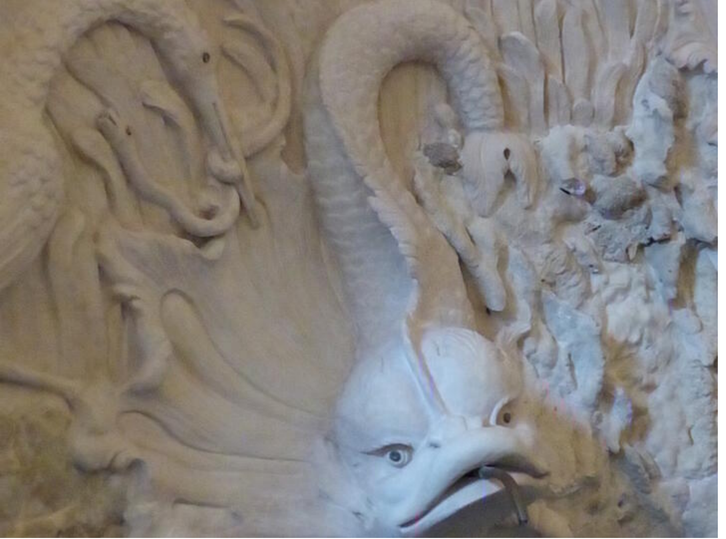
Visite guidée Saint-Antoine au fil du temps - Le temps des bâtisseurs : splendeurs du gothique